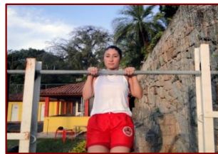
POSIÇÃO INICIAL (0)